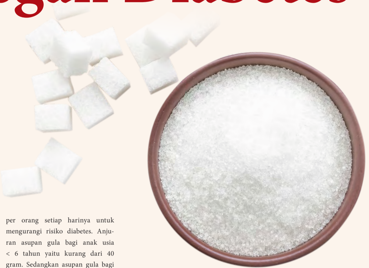
Gambar: Hubungan antara konsumsi gula berlebihan dengan gangguan kesehatan

per orang setiap harinya untuk mengurangi risiko diabetes. Anjuran asupan gula bagi anak usia < 6 tahun yaitu kurang dari 40 gram. Sedangkan asupan gula bagi dewasa antara 30-60 gram. Namun